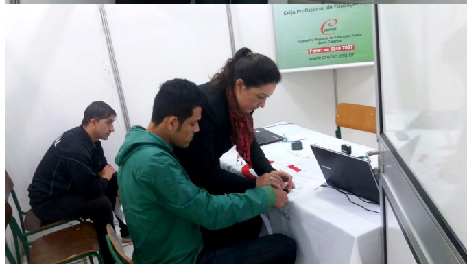
Profissionais de Educação Física em atendimento em São Miguel do Oeste, nos dias 26 e 27 de maio.