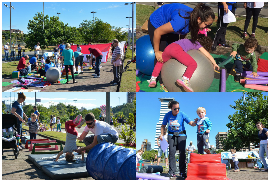
Imagens do evento que reuniu mais de 300 participantes em Blumenau