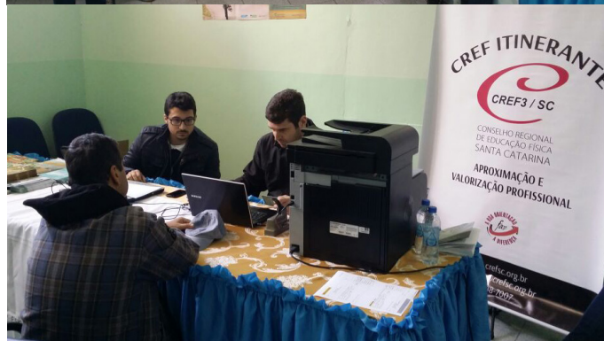
Em Brusque, nos dias 10 e 11 de junho, mais de 40 atendimentos foram realizados pela equipe do Conselho.