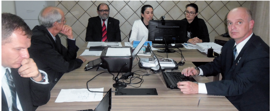
Comissão de Ética Profissional reunida

A Comissão de Ética Profissional do CREF3/SC vem atuando desde 2001 com o objetivo de fortalecer a profissão, promovendo os princípios éticos que regem a área. Em 2014, a comissão apurou dois Processos Éticos e Disciplinares: um profissional foi condenado à pena de cancelamento de registro e outro foi condenado à pena de censura pública.