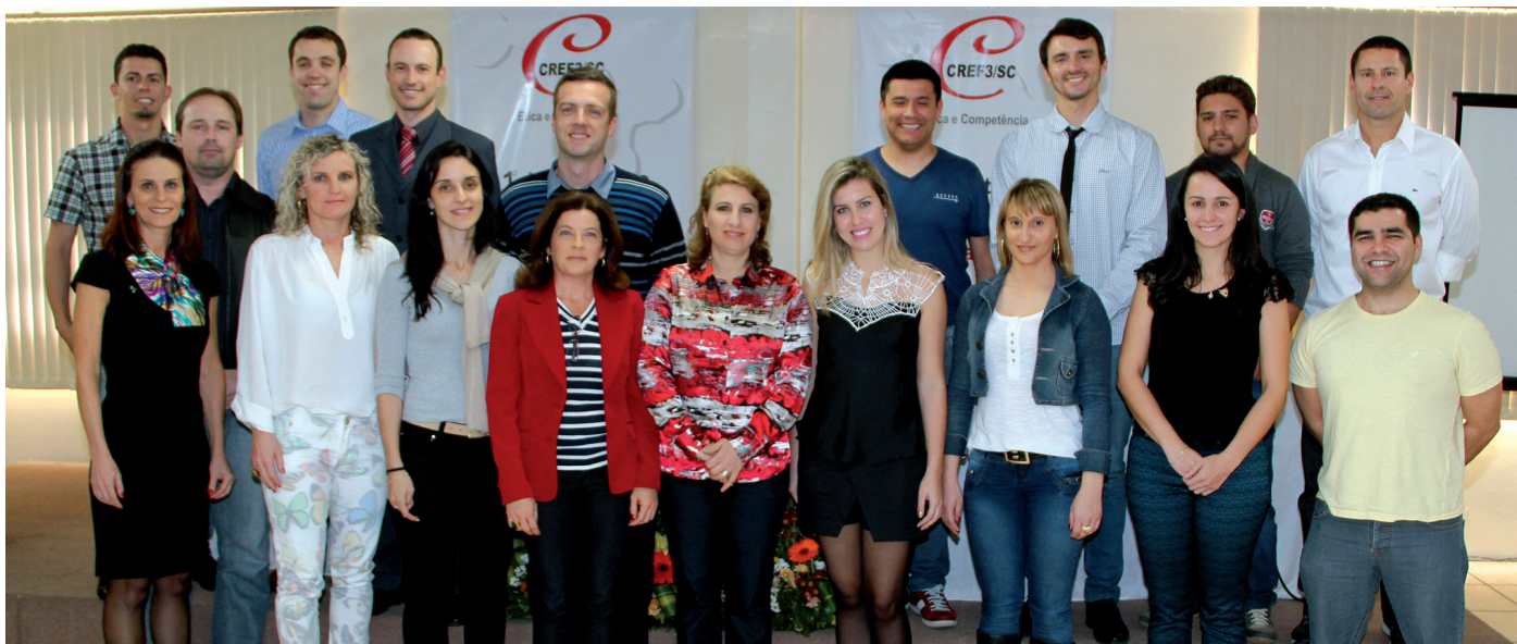
Profissionais de Educação Física autores e co-autores do Livro de Boas Práticas na Educação Física, durante o Seminário

Com tempo cronometrado e muita informação, os autores do Livro “Boas Práticas na Educação Física Catarinense” abrilhantaram o Seminário Estadual de Boas Práticas na EF Catarinense, realizado em Florianópolis, no dia 29 de agosto, também como parte das comemorações ao Dia do Profissional de Educação Física.