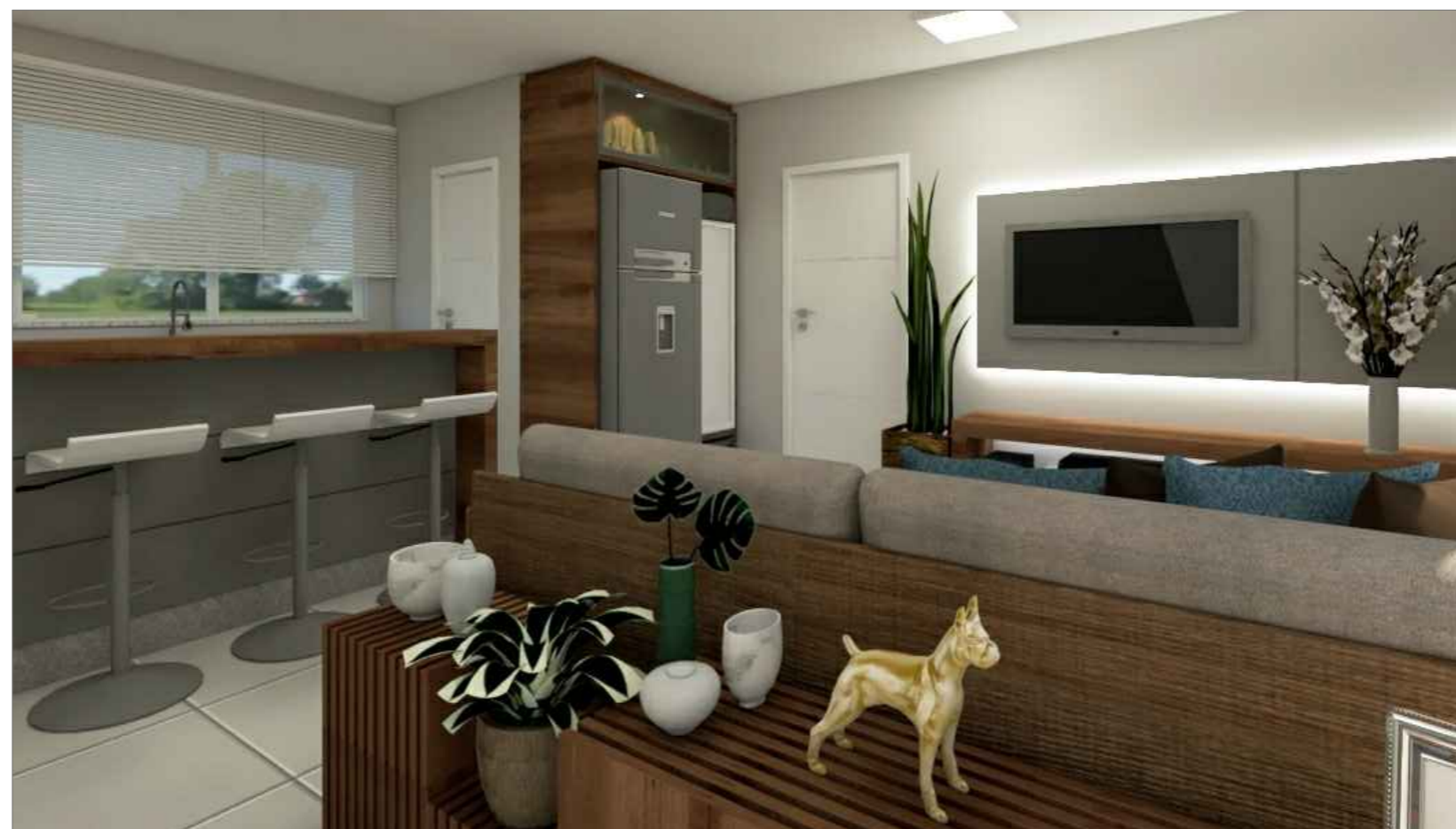
PERSPECTIVA COZINHA DOS FUNCIONÁRIOS C/ SALA TV