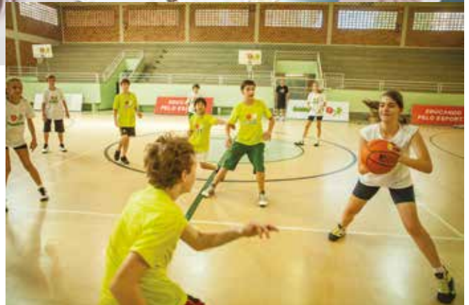
Aulas de vôlei e basquete promovidas pelo projeto

Os materiais ainda são adequados à faixa etária dos alunos: tabelas e redes são ajustáveis às alturas das crianças e as bolas possuem tamanhos e pesos variados. A equipe experiente aprendeu a discernir muito bem as diferenças do esporte de rendimento quando