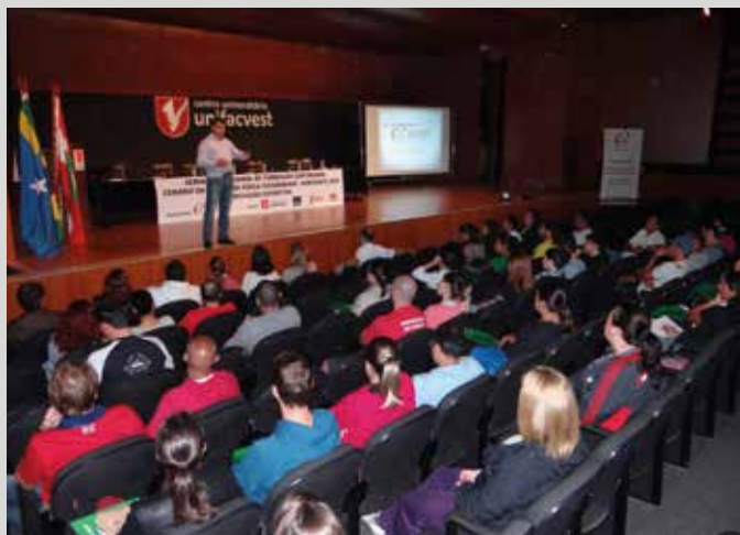
Seminário foi realizado em Lages no dia 24 de abril

Os seminários serão realizados também em Jaraguá do Sul, Brusque, Mafra, Videira, São Miguel do Oeste, São José e Joinville no segundo semestre de 2015, dando continuidade às ações do Planejamento Estratégico do Conselho previstas para o ano.