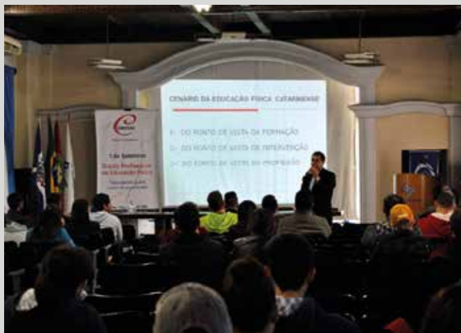
Em Tubarão, seminário foi realizado no dia 19 de junho