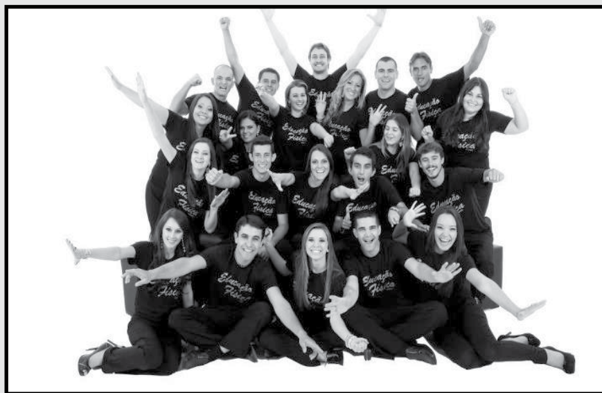
Formandos UNESC Criciúma - 18 de agosto de 2012.