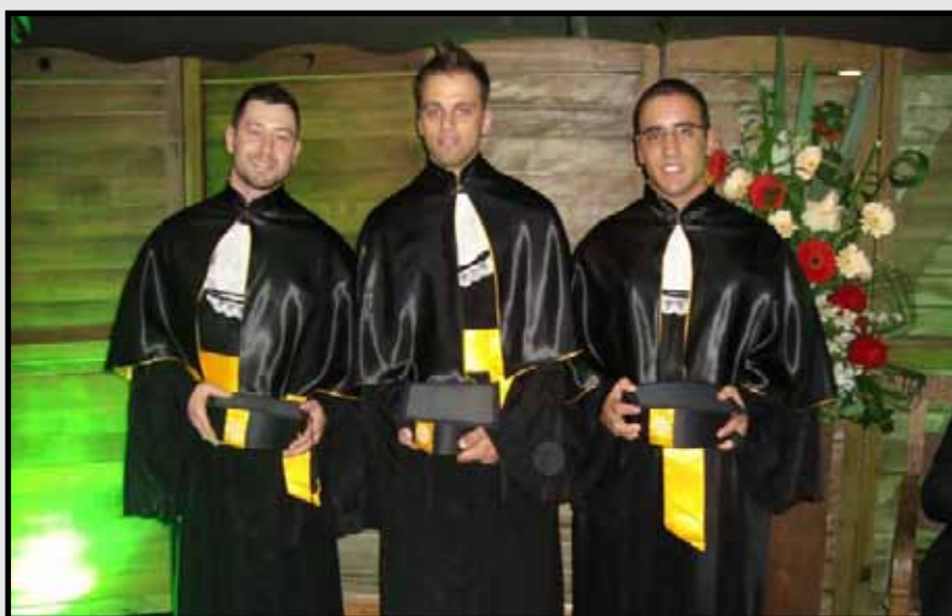
Formandos UNESC Criciúma - 18 de agosto de 2012.