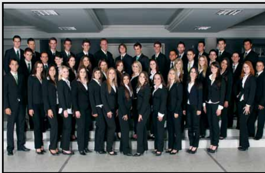
Formandos UNIDAVI Rio do Sul - 28 de julho de 2012.