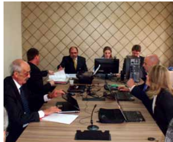
Comissão de Ética do CREF3/SC reunida em julgamento

Para denunciar, basta preencher e enviar o formulário disponível no site do CREF3/SC (www.crefsc.org.br) no link Denúncias para o e-mail etica@crefsc.org.br , ou pelo correio, para a Sede do CREF3/SC, Rua: Afonso Pena nº 625, Bairro: Estreito, Cidade: Florianópolis, CEP: 88070-650. O formulário também poderá ser entregue pessoalmente. Lembrando que para realizar uma