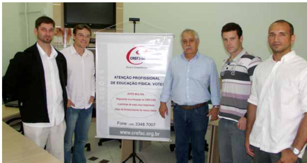
Comissão Eleitoral do CREF3/SC reunida durante a eleição, realizada na sede do conselho, em Florianópolis

Foram eleitos no dia 12 de setembro 10 novos conselheiros efetivos e quatro suplentes do CREF3/SC, que assumirão um mandato de seis anos à frente do Conselho. A chapa 1 “Renovar e Avançar” foi a vencedora do pleito, somando 61,23% dos votos válidos. A chapa 2 “Renovação”, conquistou 38,77% dos votos válidos.