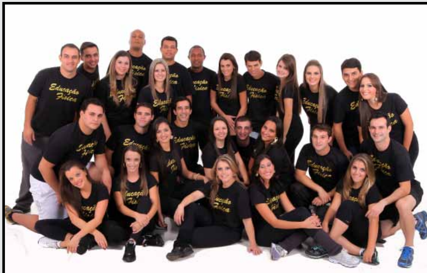
Formandos ESUCRI Criciúma - 28 de julho de 2012.

Novos profissionais de Educação Física entraram no mercado de trabalho em 2012. O CREF3/SC é uma instituição que apóia o profissional de Educação Física na busca por legitimar as intervenções profissionais, valorizando a categoria. A representatividade do CREF3/SC junto à sociedade, advém de ações efetivas para disciplinar a conduta do setor de atividade física no Estado, de maneira que ela seja exercida com ética e por profissionais habilitados para o exercício formal da profissão. Parabéns aos novos graduados!