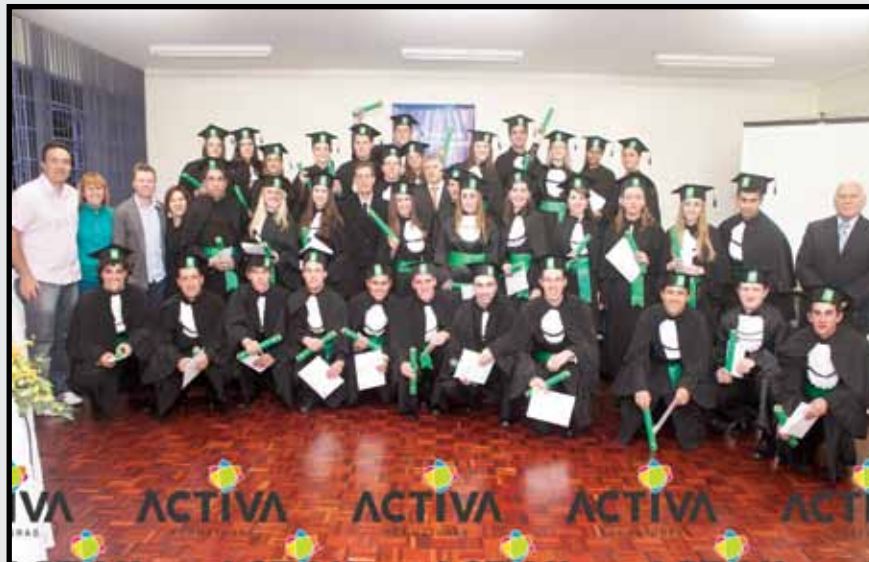
Formandos UNC Mafra - 03 de agosto de 2012.