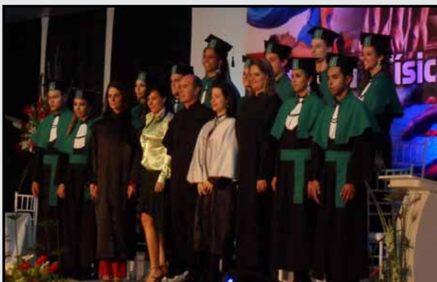
Formandos UNOESC Joaçaba - 25 de agosto de 2012.